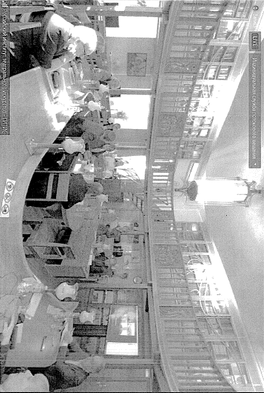
Российский институт геаррального искуства - ГТИИС